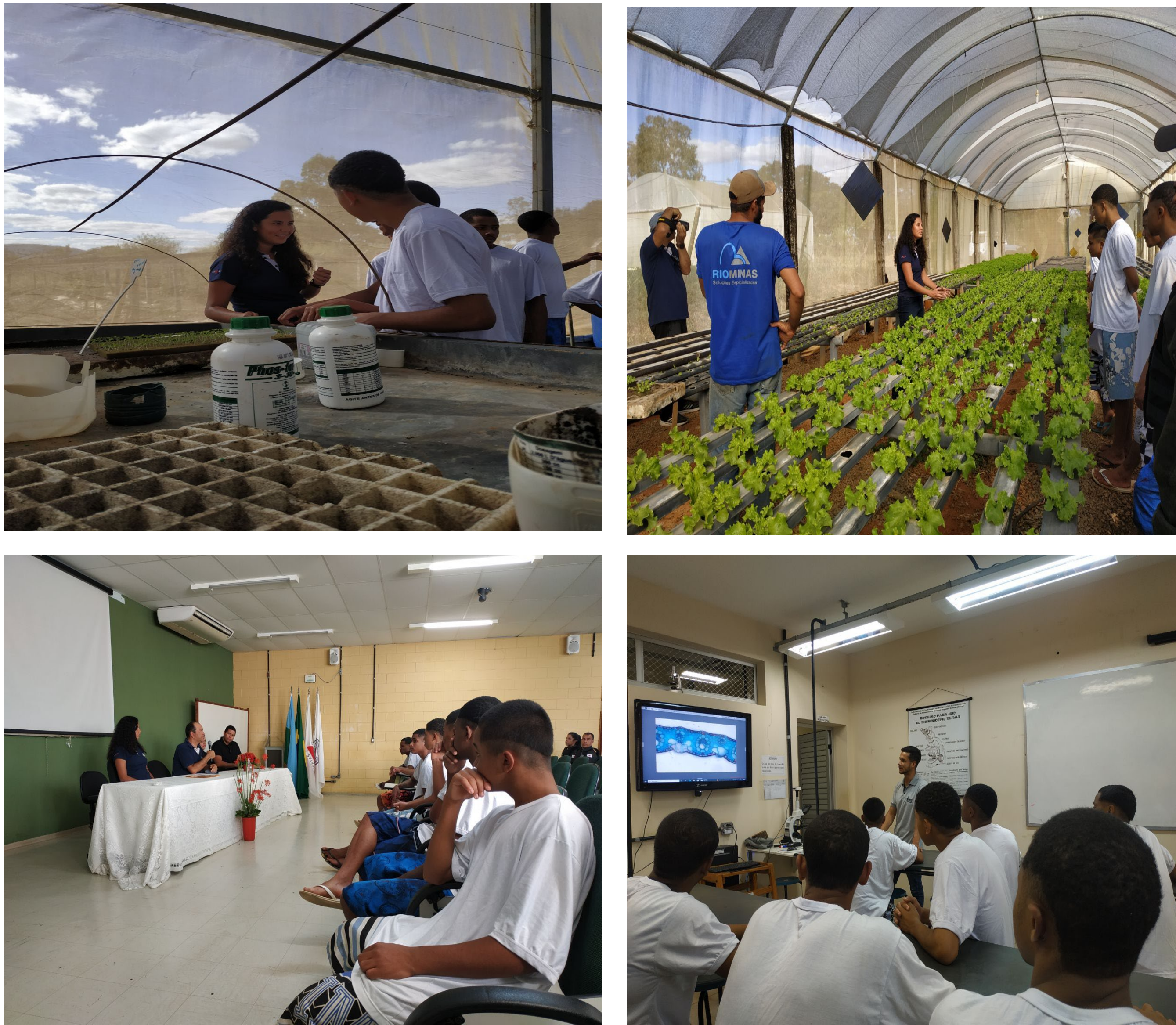
Imagens de atividades do CSEMC em parceria com a UFMG

Nas turmas de 2023 (2023.1 e 2023.2) formaram-se 20 adolescentes no curso, mostrando ótimos resultados no exame de desempenho e grande satisfação com o curso. No primeiro semestre de 2024, formou-se mais uma turma de 10 alunos, mostrando interesse pela área acadêmica e profissional. Assim, a iniciativa de extensão universitária tem papel fundamental tanto na promoção da formação profissional quanto na integração social desses jovens.